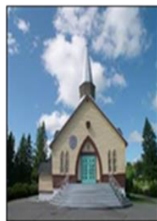
Sanctuaire N.D Etchemin 418-625-3381