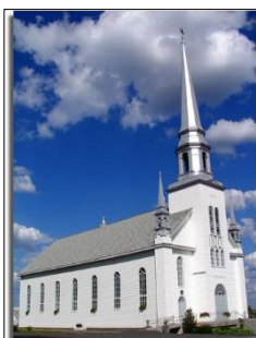
Sainte-Sabine 418-625-3381 #403