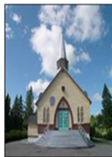
Sanctuaire N.D Etchemin 418-625-3381 #400