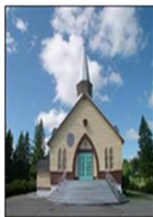
Sanctuaire N.D Etchemin 418-625-3381 #400