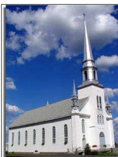
Sainte-Sabine 418-625-3381 #403