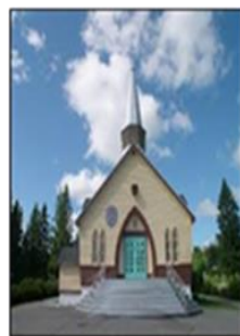
Sanctuaire N.D Etchemin 418-625-3381 #400