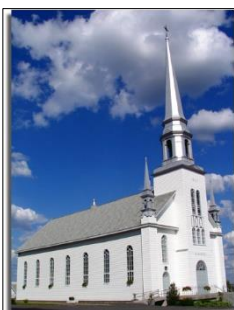
Sainte-Sabine 418-625-3381 #403