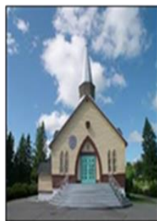
Sanctuaire N.D Etchemin 418-625-3381 #400