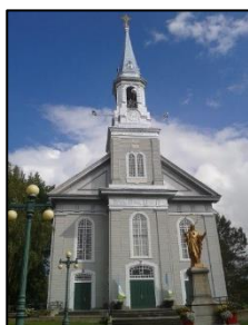
Sainte-Germaine 418-625-3381 #400