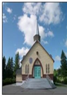
Sanctuaire N.D Etchemin 418-625-3381 #400