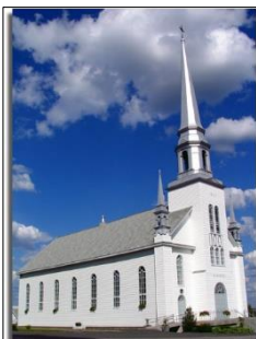
Sainte-Sabine 418-625-3381 #403