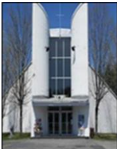
Saint-Louis 418-625-3381 #400