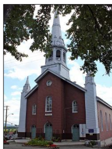
Saint-Léon 418-625-3381 #400