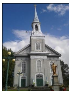
Sainte-Germaine 418-625-3381 #400