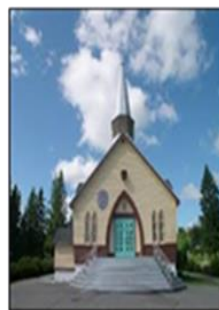
Sanctuaire N.D Etchemin 418-625-3381 #400