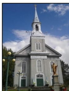
Sainte-Germaine 418-625-3381 #400