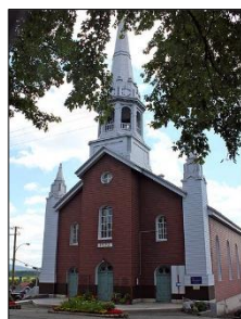
Saint-Léon 418-625-3381 #400