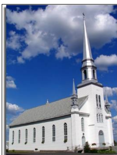
Sainte-Sabine 418-625-3381 #403