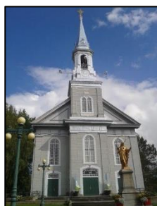
Sainte-Germaine 418-625-3381 #400