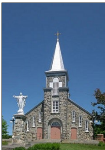
Saint-Luc 418-625-3381 #400