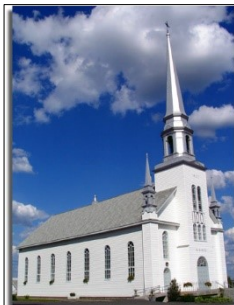
Sainte-Sabine 418-625-3381 #403