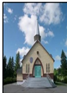
Sanctuaire N.D Etchemin 418-625-3381 #400