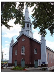
Saint-Léon 418-625-3381 #400